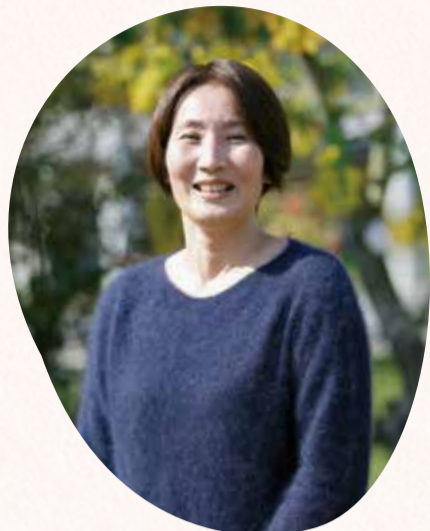
徳武産業株式会社 代表取締役社長