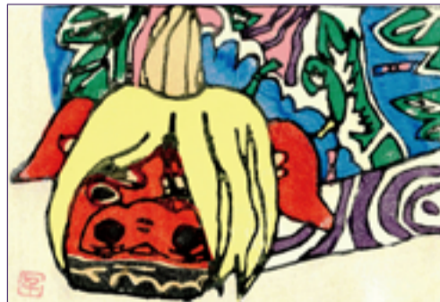
(木版画) 石川県 出村様