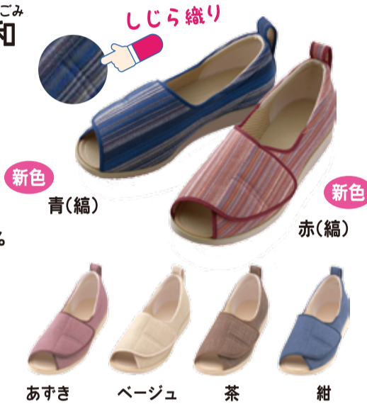
あずき ベージュ 茶 紺