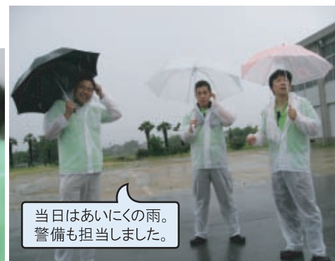
当日はあいにくの雨。警備も担当しました。