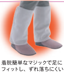
着脱簡単なマジックで足に フィットし、ずれ落ちにくい