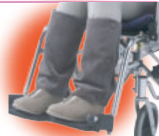
巻いて足元ぽかぽか