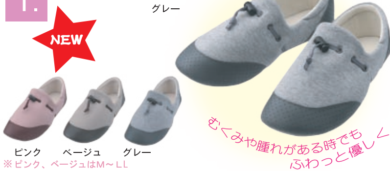
ピンク ベージュ グレー ※ピンク、ベージュはM～LL