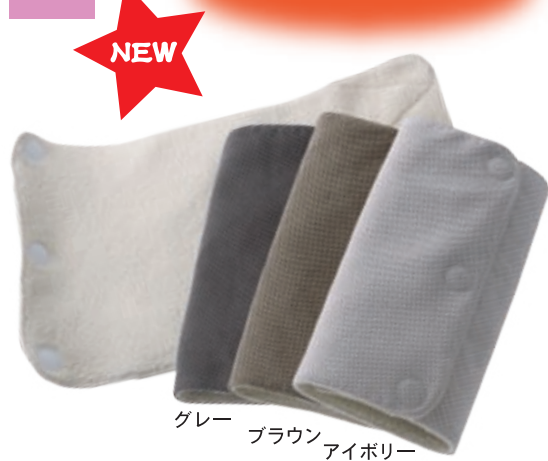
グレー ブラウン アイボリー